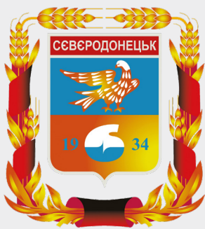
Герб Северодонецька від 1998 року (ліворуч)

Російські представники окупаційної влади в захопленому в червні 2022 року Северодонецьку Луганської області вирішили відмовитися від української символіки міста й прийняли нове «Положення про офіційні символи (герб та прапор)».