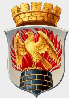
Герб окупованого Северодонецька від 2024 року (праворуч)

Прапор міста, затверджений у 1999 році, відтворював жовто-блакитний стяг України зі знаком державності – тризубом, у центрі якого також було зображення сокола-сапсана, адже місто розвинулося на місці поселення запорізьких козаків XVII століття під назвою Соколиний Юрт. Герб мав форму щита, оповитого стрічкою з колоссям, написом Северодонецьк і датою заснування міста – 1938 ( перші стовпчики окреслили місце хімічного комбінату й селища в 1933 році ). По центру щита зверху містилося зображення золотавого сокола, а нижче – колба на позначення хімічного виробництва та зображення імпульсу на позначення приладобудування. До збройного нападу Росії северодонецький «Азот» був найбільшим хімічним виробництвом України. Окупанти видалили всі символи, що пов'язували герб і прапор з історією міста української доби. Нині герб містить зображення сокола, промислової труби та корони.